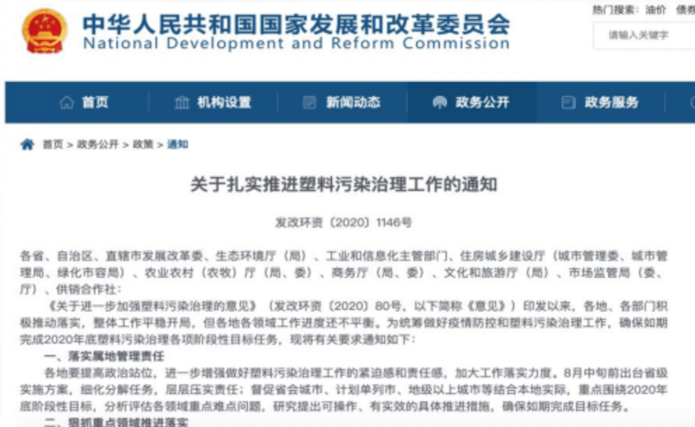
关于扎实推进塑料污染治理工作的通知