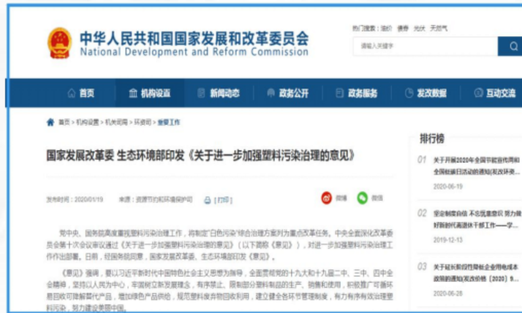
国家发展改革委 生态环境部印发《关于进一步塑料污染治理的意见》